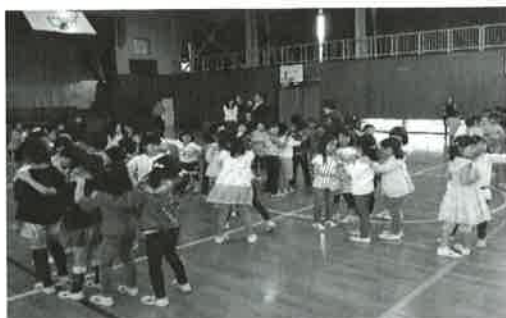
じゃんけん列車を楽しむ児童たち

今後も統合校の子どもたちが、より仲良くなるように、交流事業を継続して実施していきます。