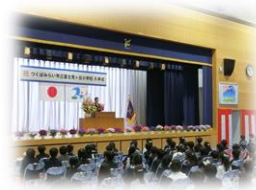
令和5年4月11日 入学式の様子