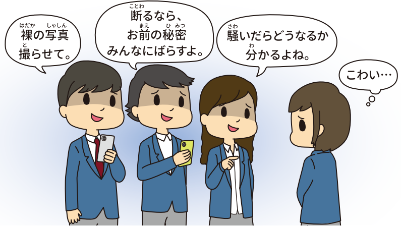
裸の写真を撮られてしまった・・・