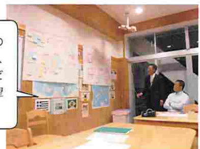
ワークショップの様子（三島小学校）

料金に関する心配やその対策、通学路の安全対策、乗車条件や乗車場所などに関するご意見・ご要望を多くいただきました。