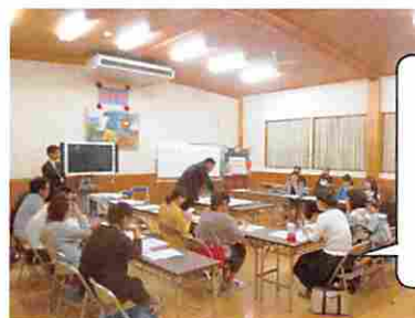
ワークショップの様子（東小学校）

料金に関する心配やその対策、運行本数、添乗員、バス停の位置や整備などに関するご意見・ご要望を多くいただきました。