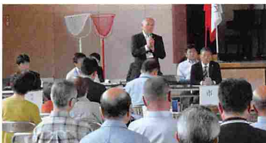
説明会当日の様子

東小学校で統合準備に関する説明会を、市長および教育長出席のもと開催しました。 当日は、地域コミュニティや児童の心のケア、スクールバスの無料化・運行などについてのご意見をいただきました。説明会の状況などの詳細は、ホームページをご覧ください。