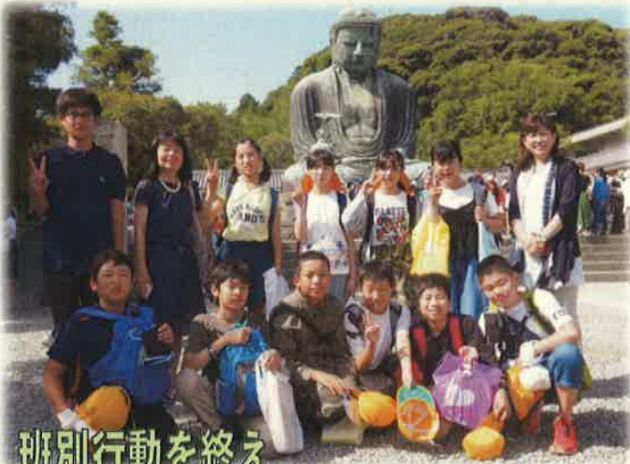
班別行動を終え 鎌倉大仏に無事 全員集合！

鎌倉での自由行動では、計画に従って行動しながら、楽しく移動できました。学校では気付かない友達のよさを発見し、より深い絆が生まれ楽しい思い出もたくさんできました。