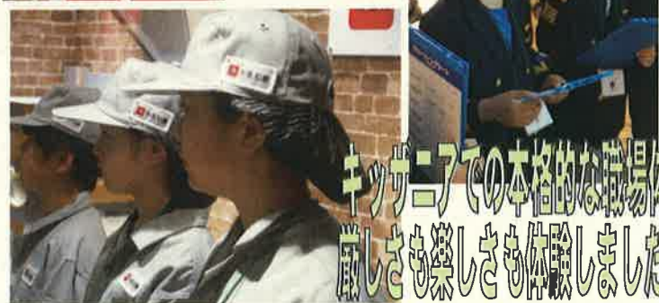
キッザニアでの本格的な職場体験！ 厳しさも楽しさも体験しました。