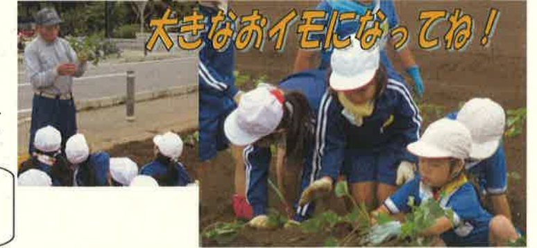
大きなお芋になってね！